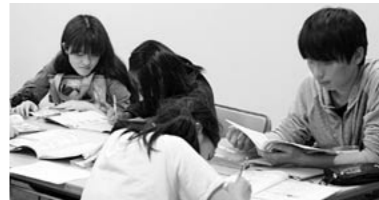
▲子どもたちに勉強を教える大学生ボランティア

護費を受給していた騒動を発端に、生活保護バッシングともいえる議論が熱を帯びている。しかし、長引く不景気の影響で本当に保護を必要としている世帯も増えている。2010年3月にさいたま市内の中学校を卒業した中学生の進学率は98・6%。しかし、生活保護世帯の生徒に限ると88・17%に下がった。複雑な家庭環境や低所得が原因で教育の機会に恵まれず、大人になっても生活保護から抜け出せないのが「貧困の連鎖、だ。