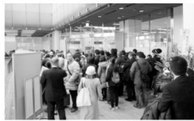
▲オープン初日の図書館前