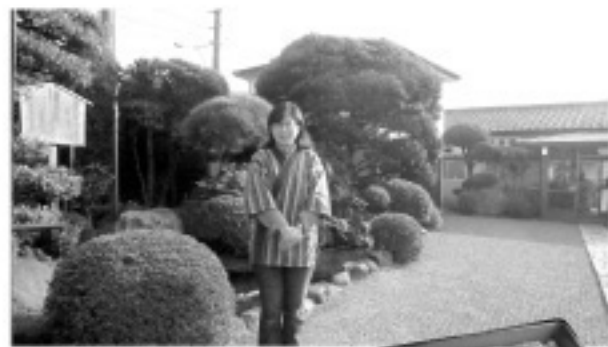
▲幸楽園の女将さんと絶品の「うなぎ」