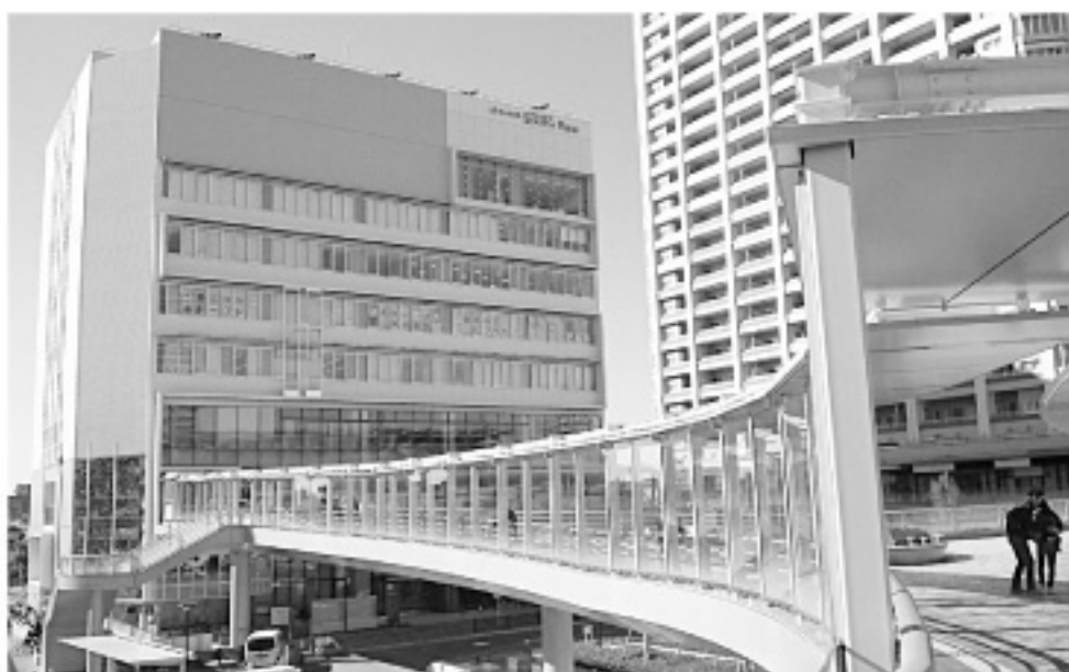
▲駅から直結のサウスピア