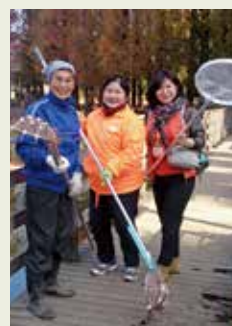
▲別所沼の清掃活動をする市民らと

別所沼開園100年に向けて、行政と市民が連携した保全活用の協議の場を設置することになりました。