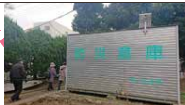
▲指定避難所に 配備されている 防災備蓄品