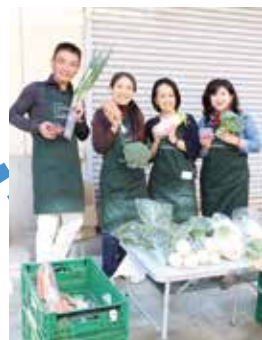
▲空き家活用のコミュニティスペースで月1回開催しているマルシェ