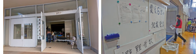
◀開設された避難所の入口(左)と避難者数や炊き出し食材のアレルギーなどを記したホワイトボード

内全域33万7千人の約3割に上ります。また、災害時に援護を必要とする人の数も2万4千人と10区で最多です。避難所施設の数に限られています。収容人員の過不足に対し民間等とも連携し早急に対策を求めるとともに、女性や高齢者、障害のある人や外国人等の多様性にきめ細かく対応できるよう、市民の声をしっかり反映した危機管理防災対策に引き続き取り組んでいきます。