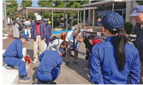
▲埼玉大学附属中学校で行われた避難所運営訓練。荒川水害時には拠点の指定避難所となる

人口が多い分、避難者数も多いのが南区の特徴です。荒川洪水の被害想定では、南区の被災人口は11万4千人、市